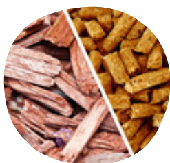
BIOMASSE (bois plaquettes ou granulés)