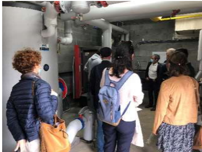
Chaudière bois de Laillé