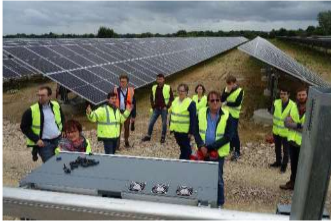
Ferme solaire de Bruz/Pont-Péan