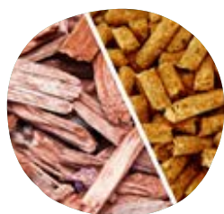
BIOMASSE (bois plaquettes ou granulés)