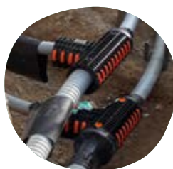
RÉSEAUX DE CHALEUR alimentés par des énergies renouvelables