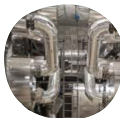
RÉCUPÉRATION DE CHALEUR FATALE